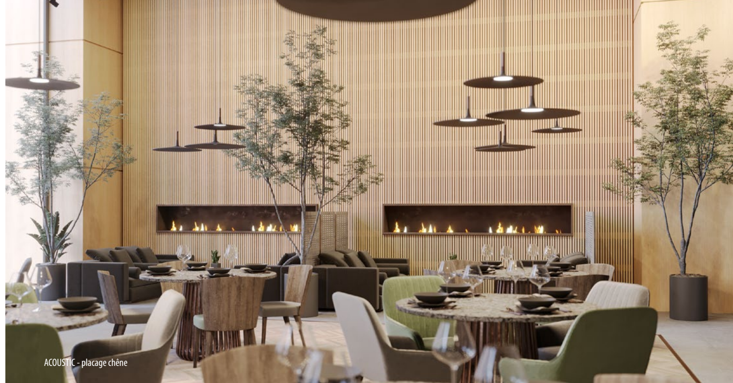
ACOUSTIC - placage chêne