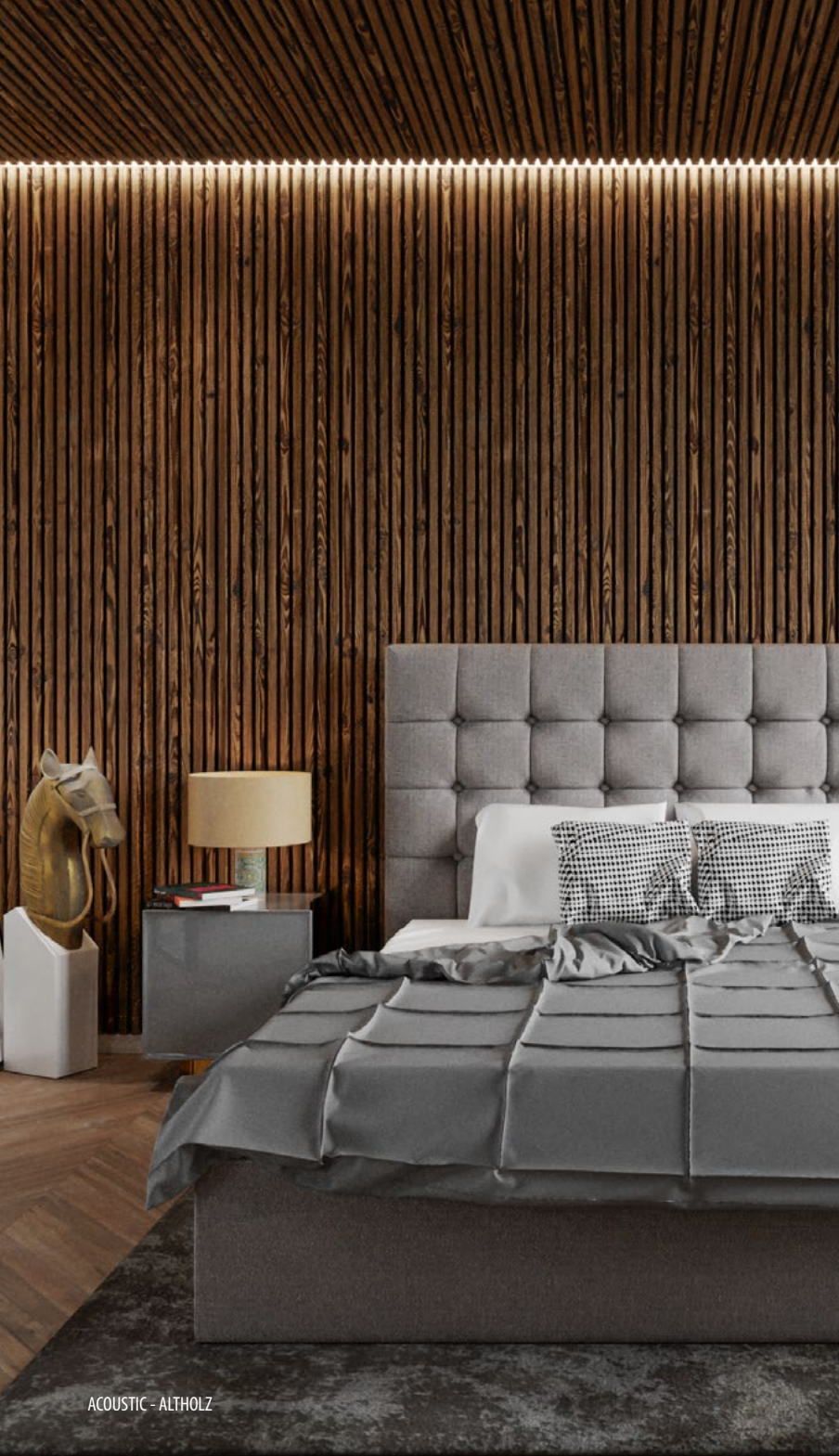
ACOUSTIC - ALTHOLZ